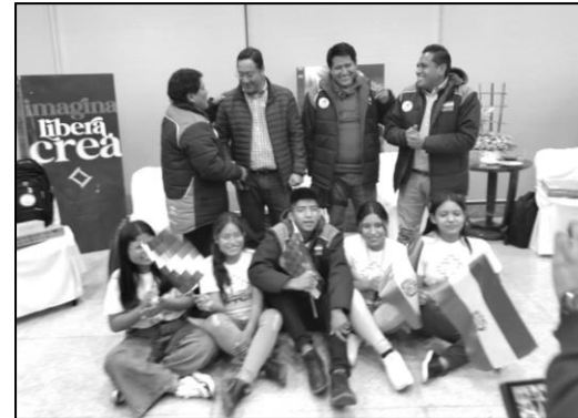
Le président de Bolivie, Luis Alberto Arce Catacora, rencontra également l'équipe.

La semaine du 26/9, ils voyagèrent à La Paz pour s'entraîner avec les spécialistes de l'AGETIC (Agencia de Gobierno Electrónico y Tecnologías de Información y Comunicación), faisant partie du Ministère de la Présidence.