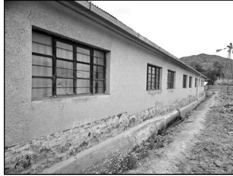
Fenêtres côté nord et ouest