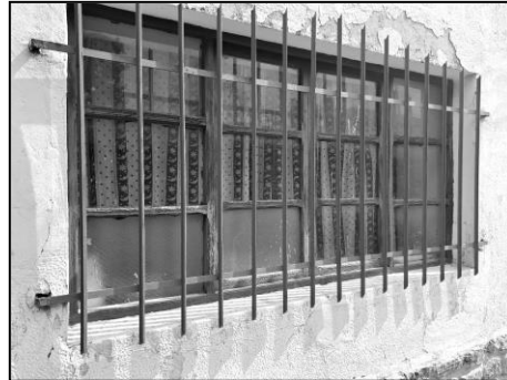
Fenêtres côté est (à renforcer)