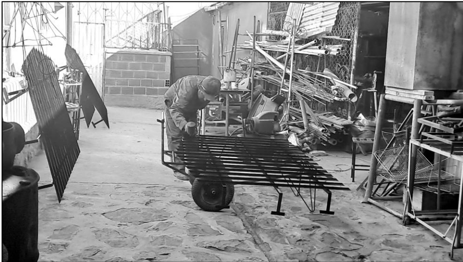
Peinture des anciennes grilles dans l'atelier paroissial