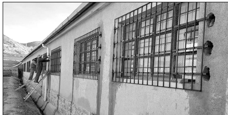
Les maçons posent les grillages sur le côté ouest de l'école.

Nous allons faire le quatrième contrat pour les autres fenêtres des entrepôts et d'autres travaux qui sont prévus dans le projet.